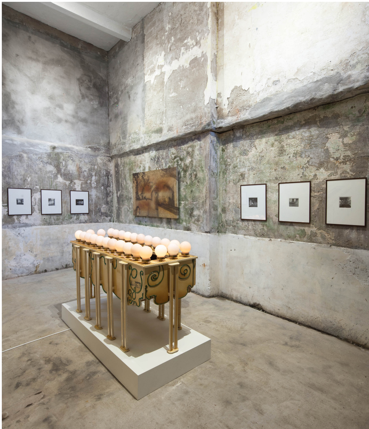
Instalazioaren ikuspegia: Alejandro Garmendia: El Ingenio Revolucionario , Villa Magdalena, Donostia.