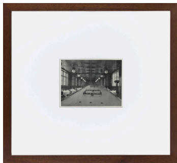
Alejandro Garmendia Izenbururik gabea 1995 Fotomuntaketa 48 x 53 cm (19 x 21 pulgadas)