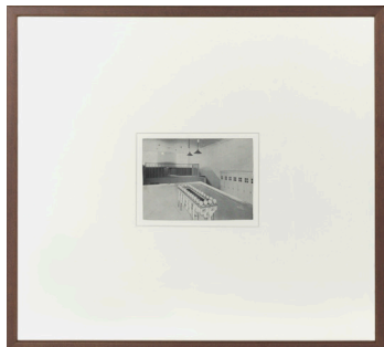
Alejandro Garmendia Izenbururik gabea 1995 Fotomuntaketa 44 x 47 cm (17 x 19 pulgadas)