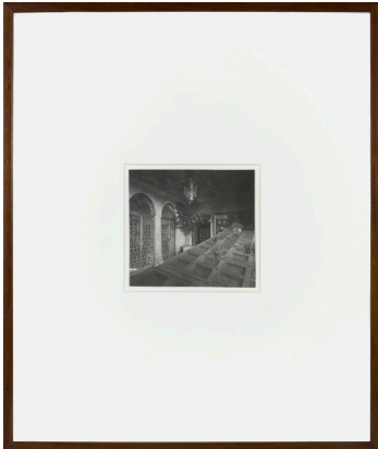
Alejandro Garmendia Izenbururik gabea 1998 Fotomuntaketa 57 x 48 cm (22 x 19 pulgadas)