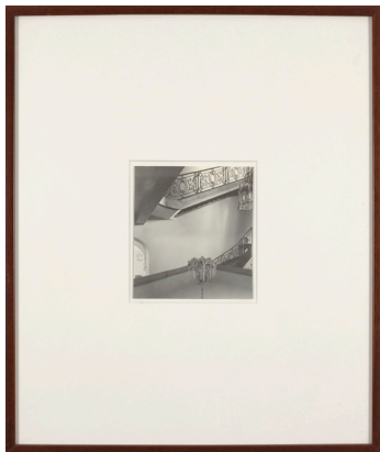
Alejandro Garmendia Izenbururik gabea 1995 Fotomuntaketa 57 x 48 cm (22 x 19 pulgadas)