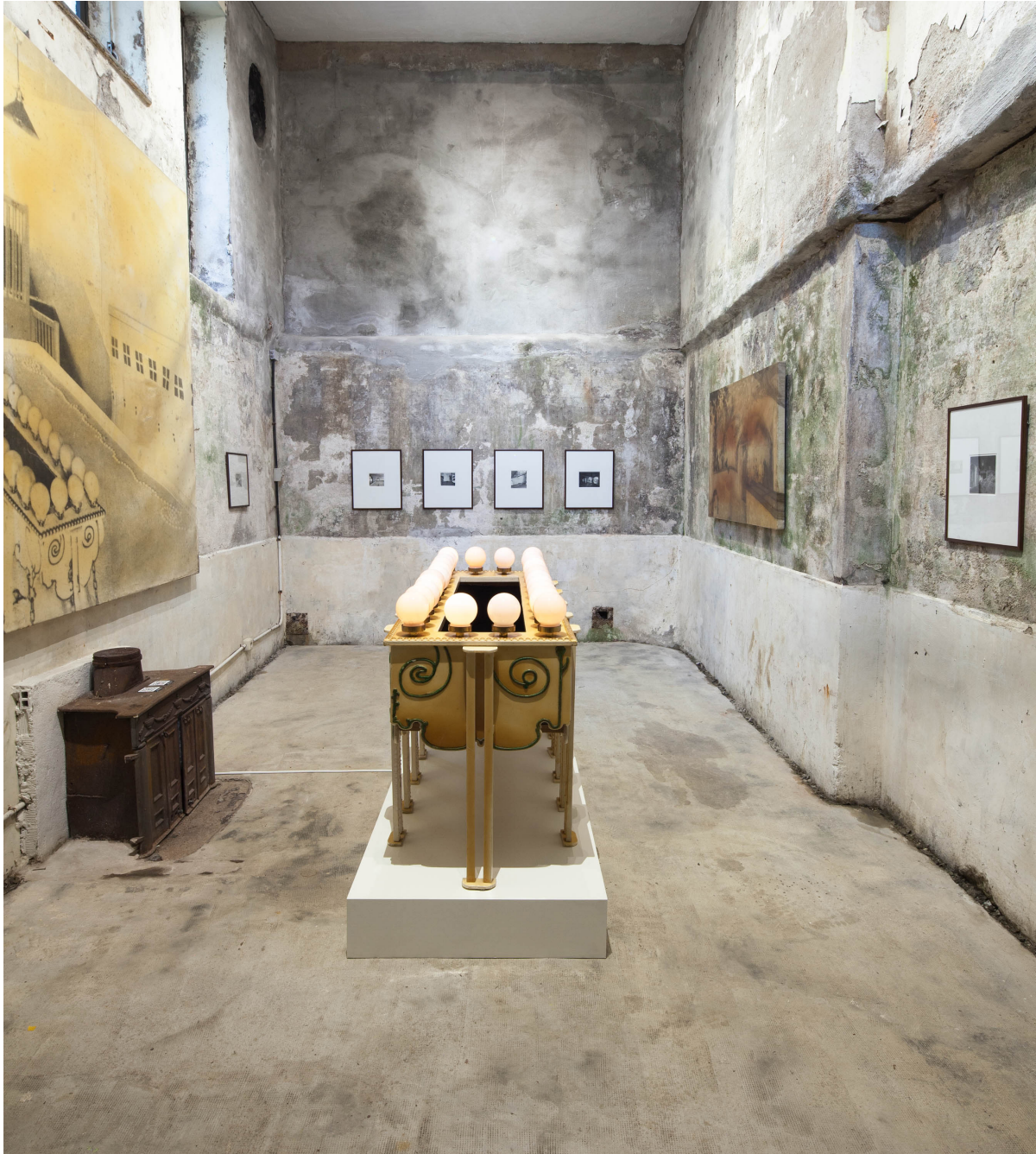
Instalazioaren ikuspegia: Alejandro Garmendia: El Ingenio Revolucionario , Villa Magdalena, Donostia.