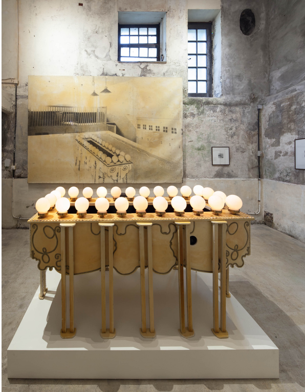
Instalazioaren ikuspegia: Alejandro Garmendia: El Ingenio Revolucionario , Villa Magdalena, Donostia.