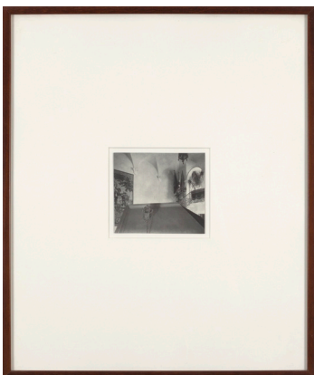
Alejandro Garmendia Izenbururik gabea 1995 Fotomuntaketa 57 x 48 cm (22 x 19 pulgadas)