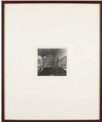
Alejandro Garmendia Izenbururik gabea 1995 Fotomuntaketa 57 x 48 cm (22 x 19 pulgadas)