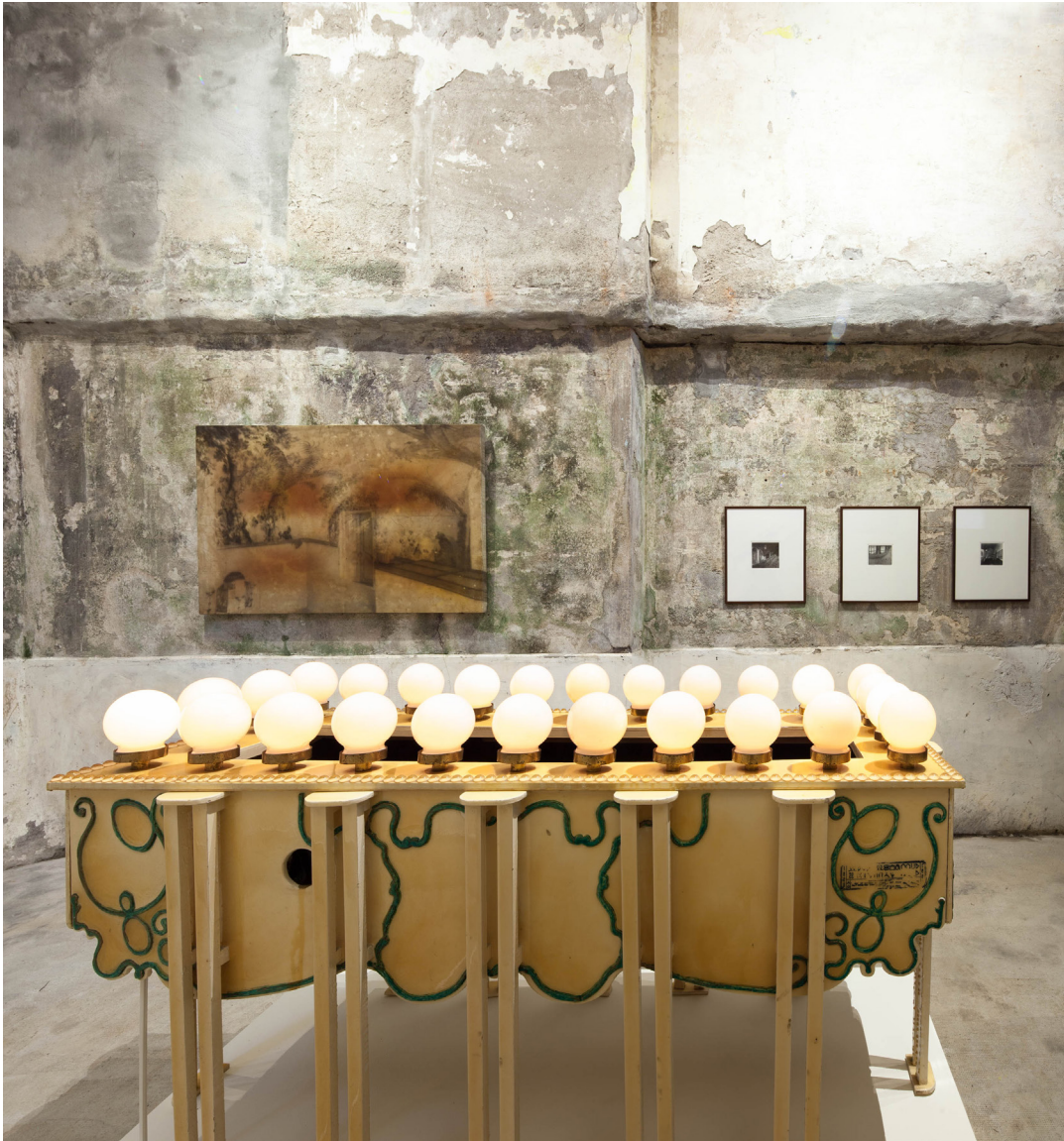
Instalazioaren ikuspegia: Alejandro Garmendia: El Ingenio Revolucionario , Villa Magdalena, Donostia.