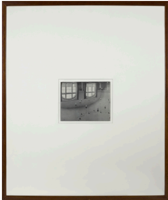
Alejandro Garmendia Izenbururik gabea 1998 Fotomuntaketa 57 x 48 cm (22 x 19 pulgadas)