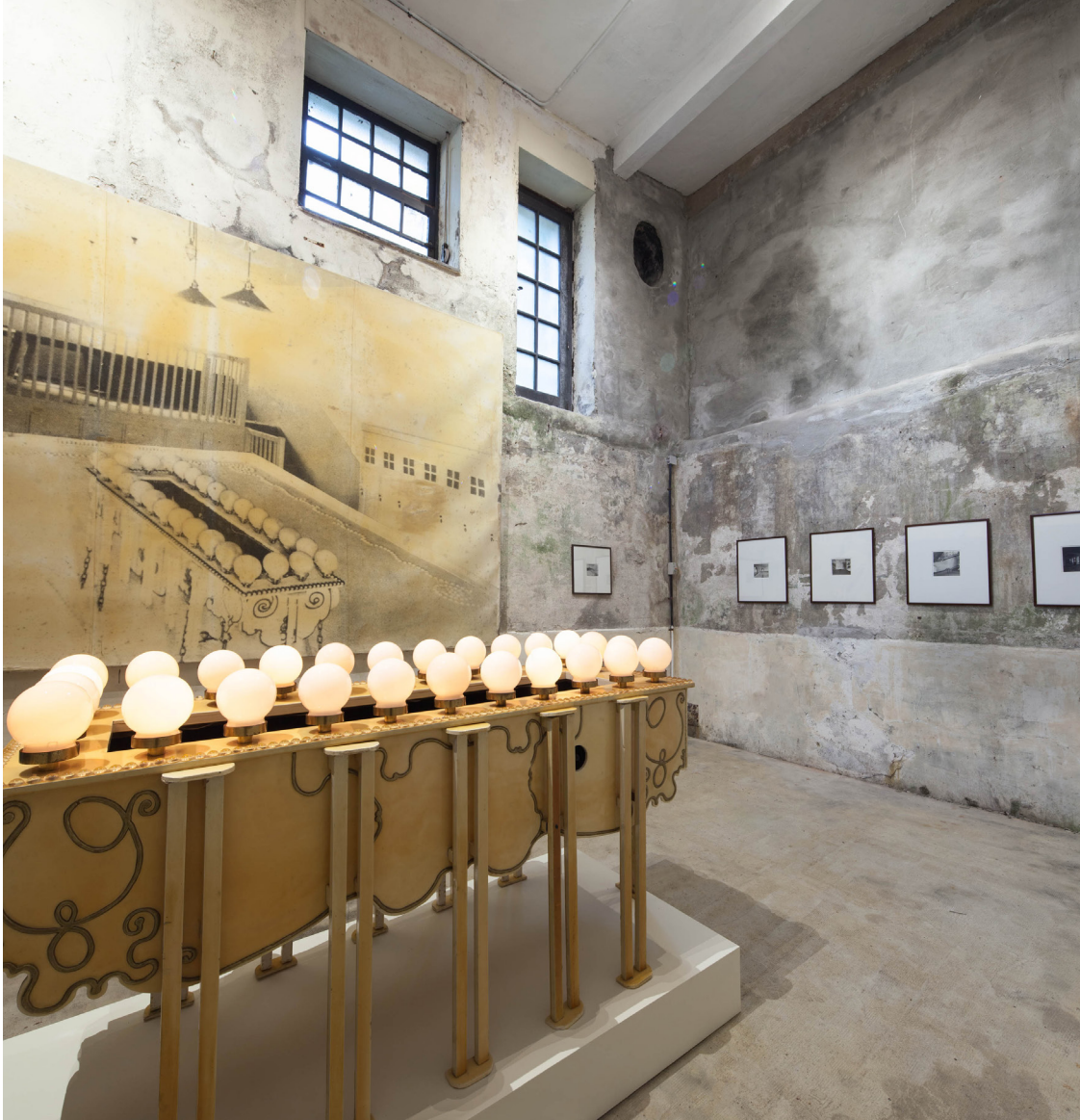
Instalazioaren ikuspegia: Alejandro Garmendia: El Ingenio Revolucionario , Villa Magdalena, Donostia.