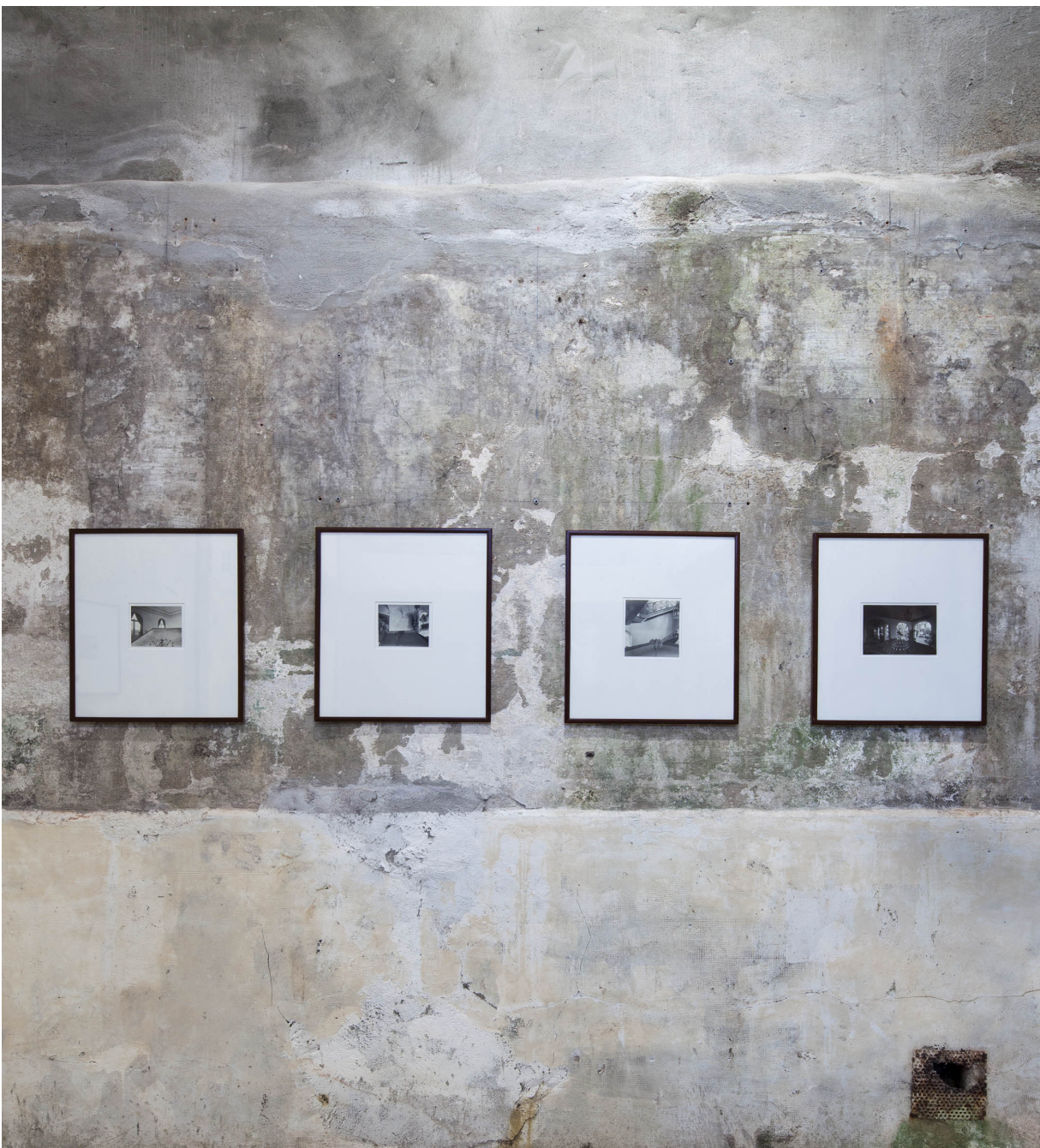
Instalazioaren ikuspegia: Alejandro Garmendia: El Ingenio Revolucionario , Villa Magdalena, Donostia.