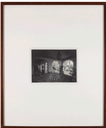
Alejandro Garmendia Izenbururik gabea 2004 Fotomuntaketa 57 x 48 cm (22 x 19 pulgadas)